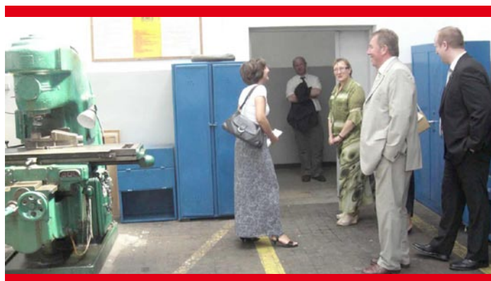
Z wizytą w ZS im. W. Goetla w Suchoy Beskidzkiej