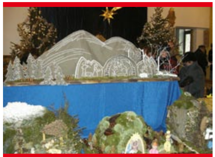
Nagrodzona szopka W. Rzeszółko i B. Kowalcze