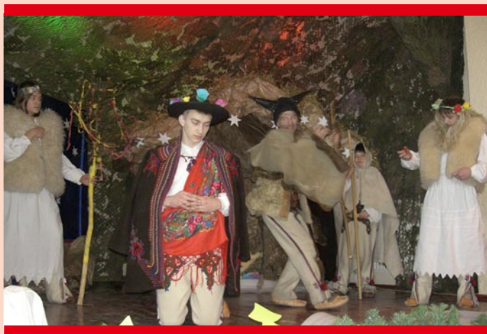
Grupa kolędnicza „Juzyna”