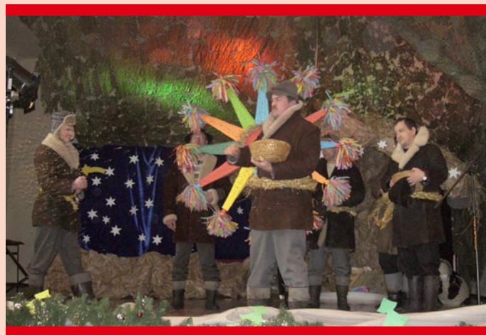
„Kolędnicy z Gwiazdą” z Juszczyzna