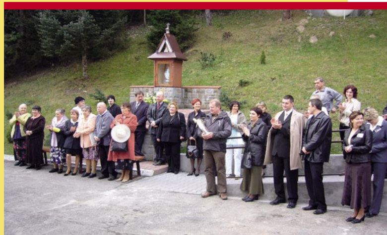
Podczas otwarcia pawilonu