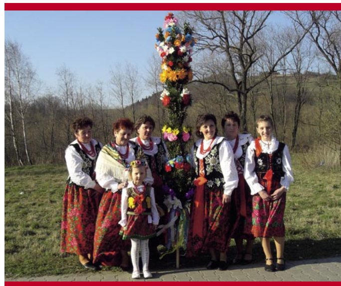
KGW Żarnówka z najwyżej ocenioną palmą wielkanocną