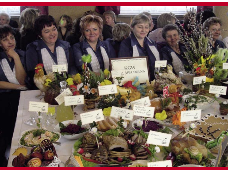
KGW Tarnawa Dolna – laureatki pierwszego miejsca w kategorii potraw wielkanocnych