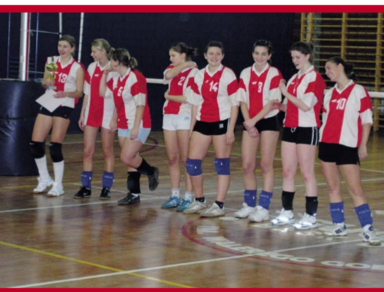
Zwycięska drużyna siatkarek ZSO Sucha Beskidzka