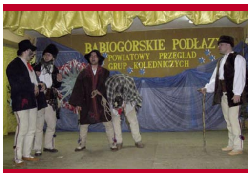
Grupa kołędnicza „Kicora” z Zawoi

Natomiast w kategorii dorosłych bezkonkurencyjna okazała się grupa kołędnicza „Kicora” z Zawoi, która w pokonanym polu pozostawiła zdobywców dwóch równorzędnych II nagród – grupę „Osielcanie” z Osielca oraz grupę kołędniczą z Zespołu Szkół im. bł. ks. Piotra Dańkowskiego w Jordanowie. Wszystkie trzy grupy rywalizujące w tej kategorii grupy zaprezentowały tak wysoki poziom, że zostały zakwalifikowane przez jury do udziału w XXXV Jubileuszowym Góralskim Karnawale w Bukowinie Tatrzańskiej.