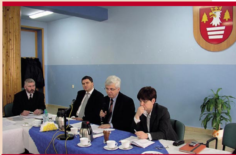
Od lewej: W. Sarlej oraz posłowie: A. Chwierut, S. Rydzoń, B. Szydło