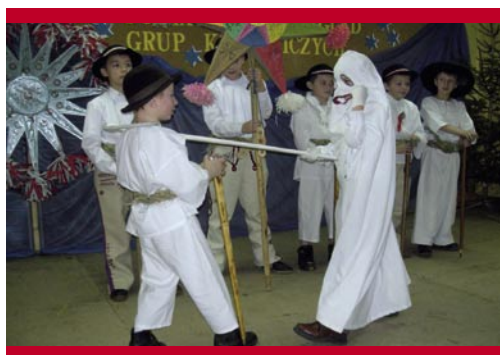
Grupa kołędnicza z Łętowni