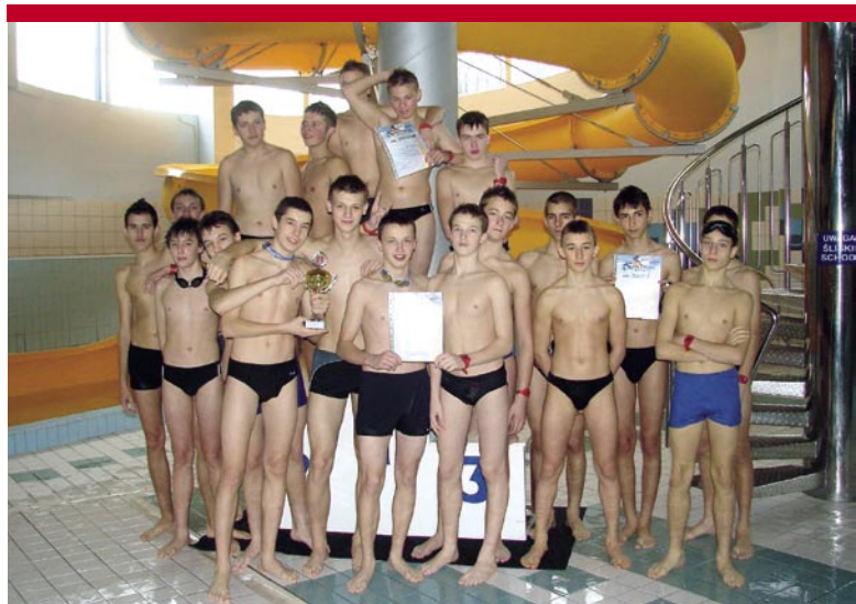
Zwycięskie sztafety gimnazjalistów